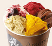
À PARTAGER 1 200XPF