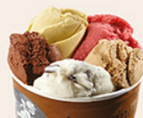
GÉANT 1 000XPF